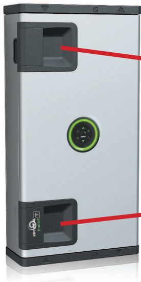
* Filterklappe ABL Abluft (M5)